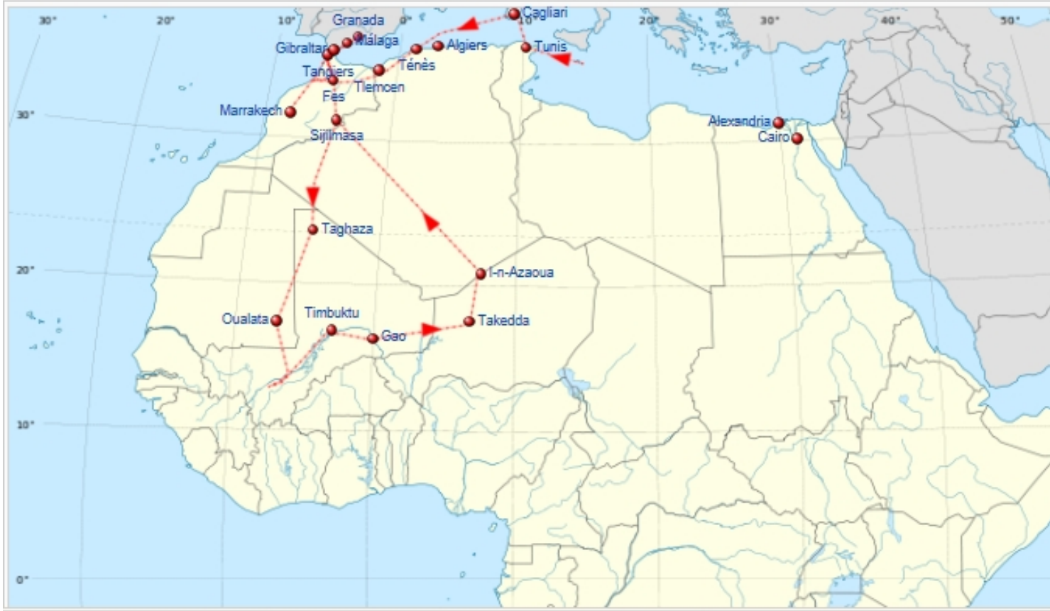
İbn-i Batuta'nın güzergâhı 1349-1354 (Kuzey Afrika, İspanya, Batı Afrika)